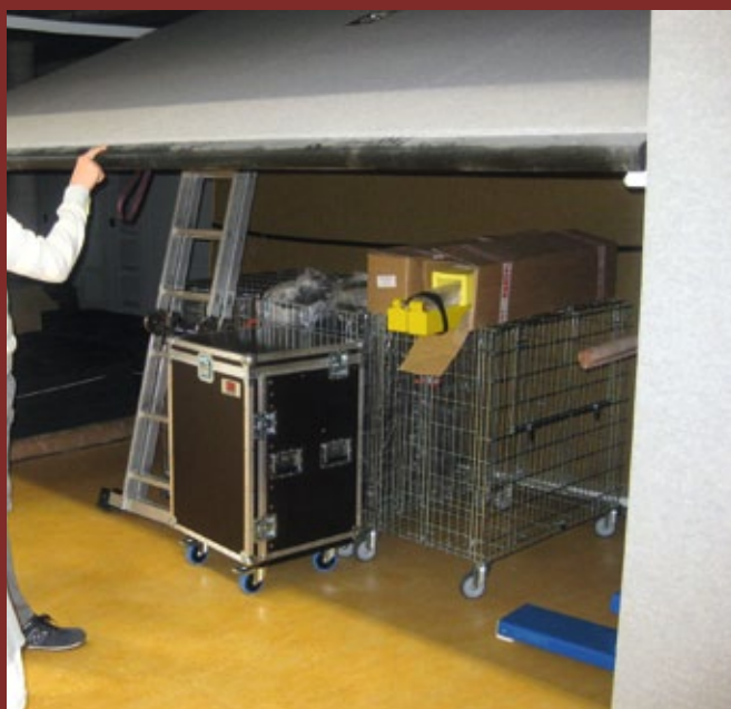
Hier wird gerade eine Sicht- und Funktionskontrolle durchgeführt.

Der Betreiber hat die Verantwortung, eine Gefährdungsbeurteilung für die Geräteraumtore zu erstellen. In dieser Gefährdungsbeurteilung werden anhand technischer Prüfstandards/ Normen und insbesondere mit den Angaben der Betriebsanleitung des Herstellers der Umfang, die Qualifikation der Prüfer sowie die Prüfintervalle festgelegt.